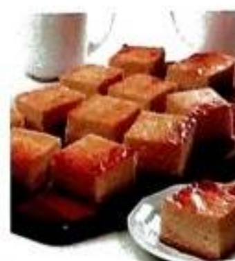
98 Страви з сиром