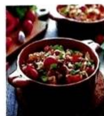
103 Пісні страви