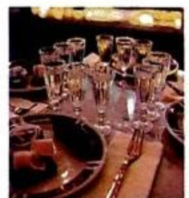
134 Традиції застілля