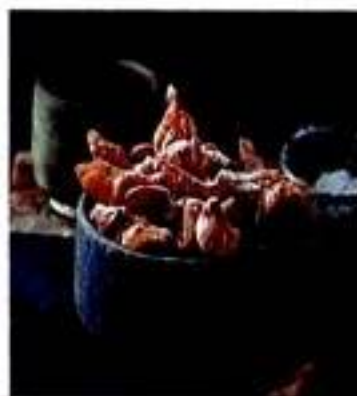
124 Солодкі страви