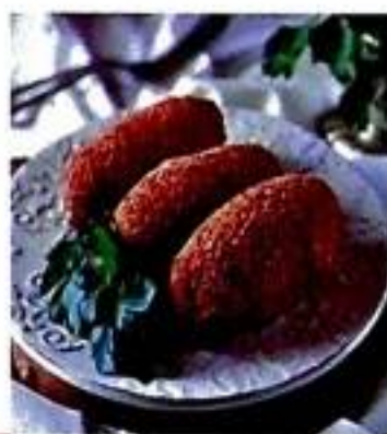
76 Котлета по-київськи