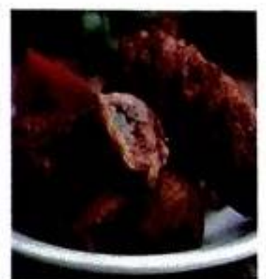
80 М'ясні страви