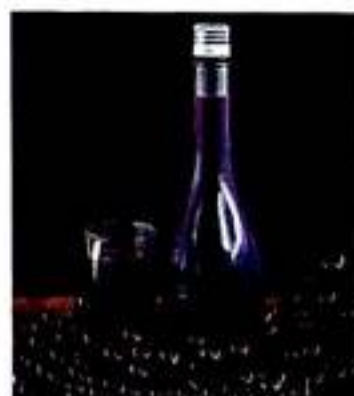
128 Спиртні напої